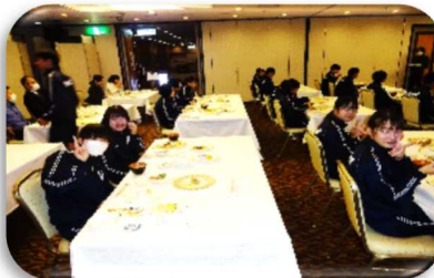
<ホテルの食事会場>