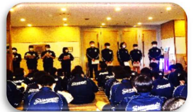
<部屋長会議の様子>