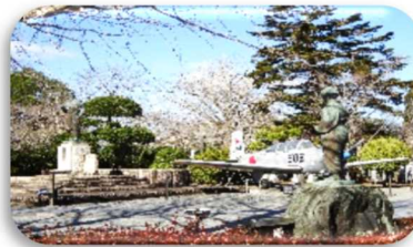
<知覧 特攻平和会館>

この旅行にあたり、実行委員、班長、部屋長のみなさんをはじめ2年生全員が旅の成功に頑張ってくれたことに感謝します。