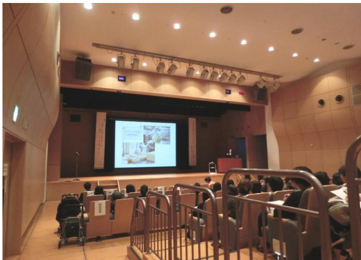
↑【会場の様子】福岡市市民福祉プラザ(ふくふくプラザ)で行いました。

卒業生の方からは、学校生活や社会人生活について、また、保護者の方からは、小・中学校時代に取り組まれたことや、高等部での様子についてお話をしてもらいました。保護者の方の、「どこの学校に通うかではなく、どのように 3 年間を過ごすかが大切。本人のやる気と、親の強い気持ちがあれば、きっといい結果につながると思います。」という想いが参加者へ伝えられました。