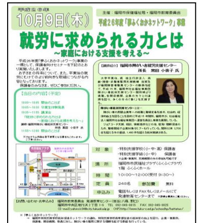
↑参加者募集チラシ