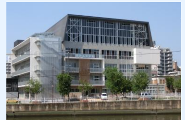
【セミナー会場】福岡市立特別支援学校「博多高等学園」