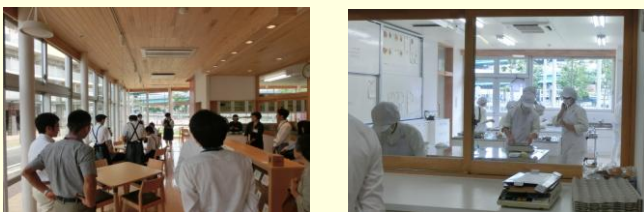
(左写真) 接客練習を行う生徒の様子を見学する参加者 (右写真) パンや焼き菓子を作る生徒