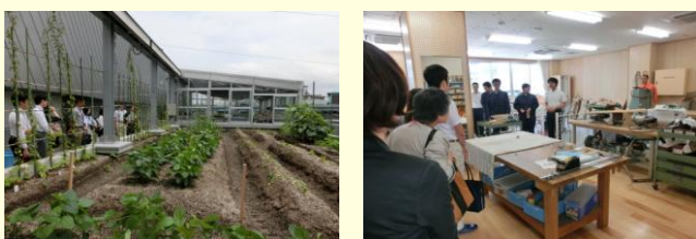
(左写真) 屋上菜園を見学する参加者 (右写真) 生徒から木工作業に関する説明を受ける参加者

野菜の栽培や水耕栽培、木工品の製作、企業での作業（野菜や果物の袋詰め、花壇の管理）等を行っています。