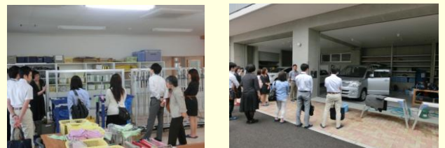
(左写真) 生徒が使う、業者と同じ清掃道具を見学する参加者 (右写真) 洗車を行う生徒の様子を見学する参加者

ビル清掃や洗車、介護周辺業務に関する学習、企業での作業（清掃、洗車、介護周辺等）等を行っています。