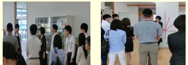
(左写真) 生徒から作業内容に関する説明を受ける参加者 (右写真) 会釈・敬礼・最敬礼の練習の際活用する赤テープ

企業からの受託作業、布製品の加工、企業での作業（倉庫管理の補助）等を行っています。