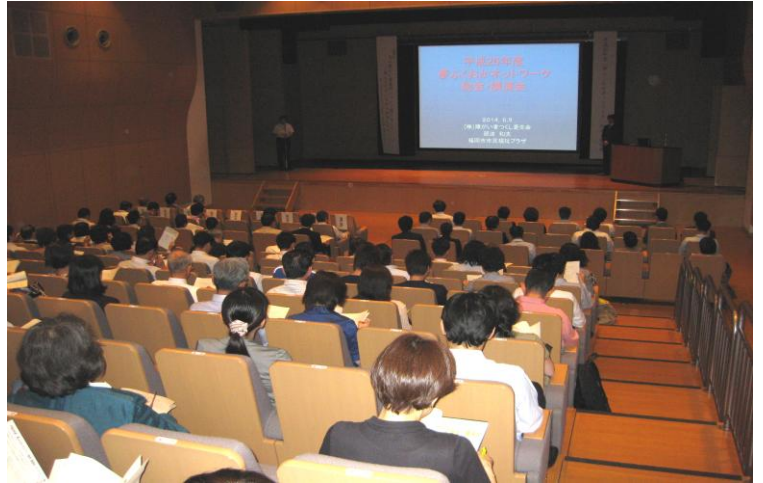
↑【会場(講演会)の様子】福岡市市民福祉プラザ(ふくふくプラザ)で行いました。135 名の方に参加いただきました。

総会では、平成 25 年度事業報告・平成 26 年度事業計画説明を行いました。また、福岡市立特別支援学校高等部卒業生の就労に関する課題や、それに対する取組について補足説明を行いました。スライド上映では、福岡市立特別支援学校の様子や平成 25 年度「夢ふくおかネットワーク」事業の様子を紹介しました。