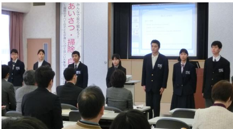
↑【自己紹介の様子】自己紹介も行いました。自分の将来の目標や夢を上手にアピールする生徒がいました。

企業の方に特別支援学校の生徒の様子を知っていただくこと、特別支援学校の生徒が企業の方と接する機会をつくることをねらいとし、当日の受付、案内を福岡市立特別支援学校高等部生徒が行いました。とても好評でした。