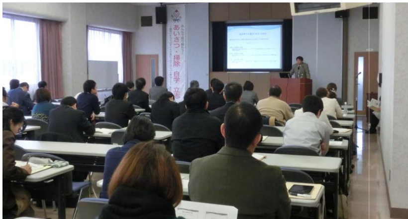
↑【会場の様子】当日は 56 名の方に参加いただきました。

アンケートの感想からも、今回の講話が参加者にとって大変有意義なものであったことが伝わりました。