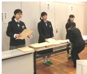
↑【受付の生徒の様子】←