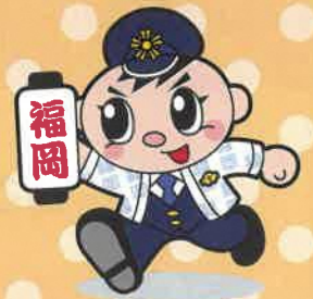
福岡県警察 シンボルマスコット 「ぶっけい君」